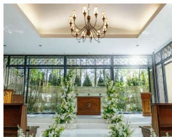
Eines Villa di Nozze